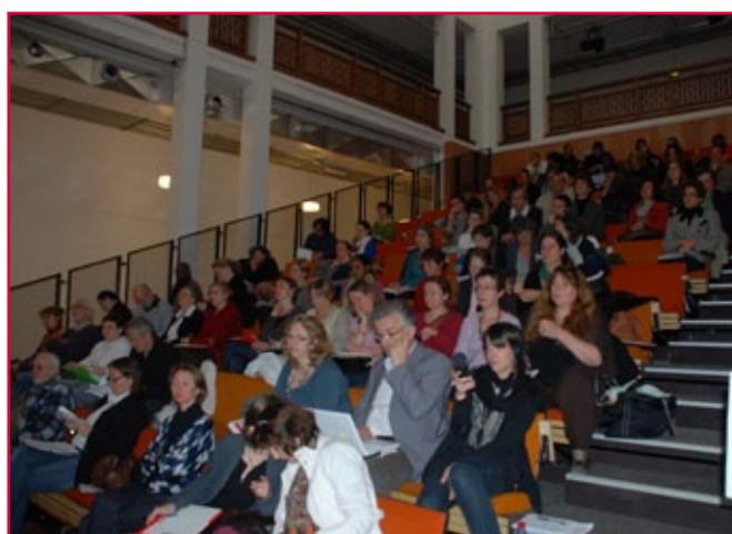
21 janvier 2010 (photo haut), 6 mai 2010