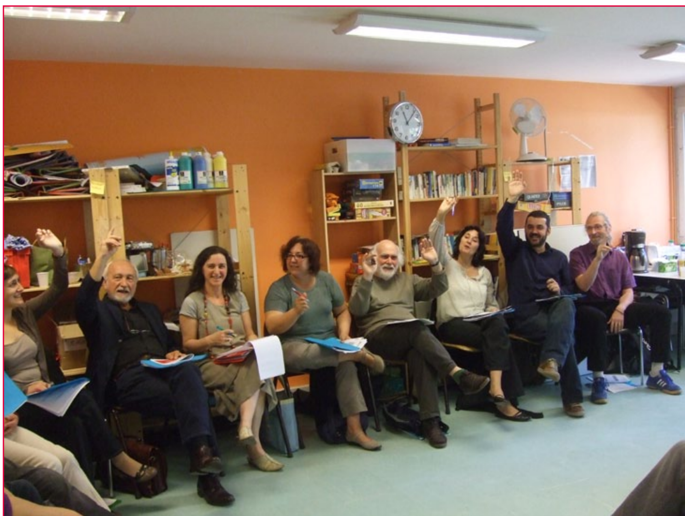
Assemblée générale du 22 juin 2010

La CRAJEP a par ailleurs largement diffusé l'information et fait connaître les différents dispositifs régionaux de soutien ou d'orientation des associations d'éducation populaire vers les dispositifs concernés (au moyen de sa lettre mensuelle et sur son site internet, rubrique « appels à projets » http://www.crajep-idf.org/appels ).