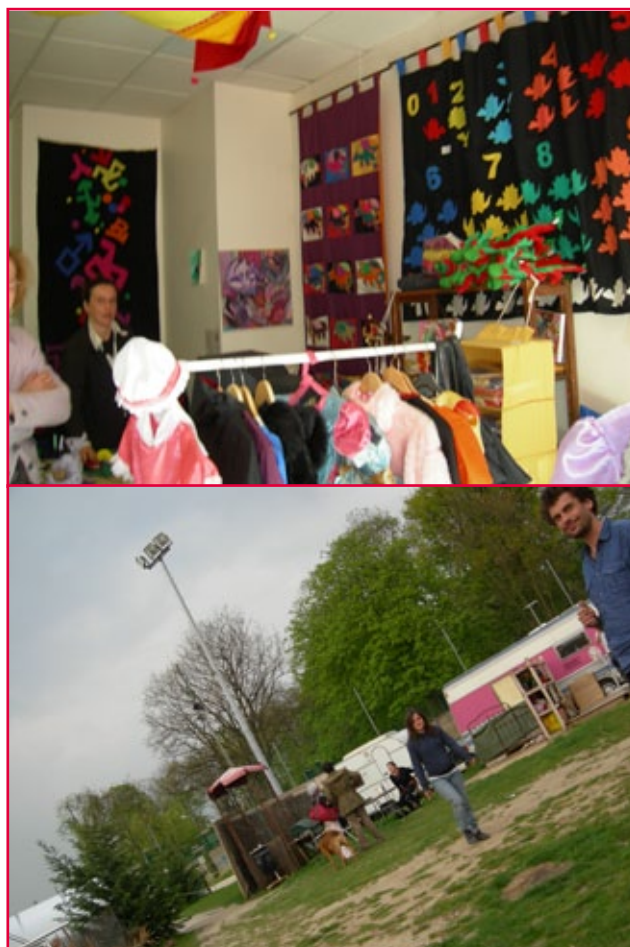
Visites sur place Caravansérail (en haut) et 360°Sud

Pour ce faire, la question de la gestion du dispositif