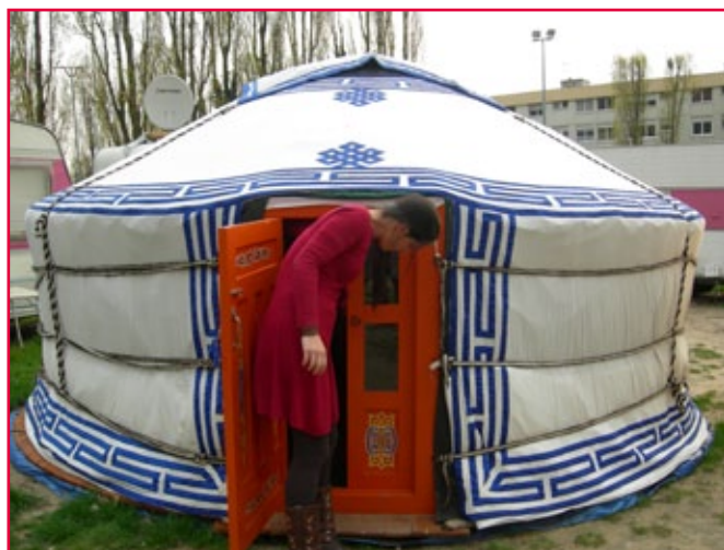
Visite sur place 360°Sud

Par ailleurs, des visites sur place ont été organisées auprès de 26 porteurs de projets conventionnés, dont certaines par des accompagnateurs du réseau (Coordination des Fédérations de centres sociaux, URFJT, FIA-ISM).