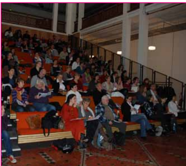
Assemblée des participants, Auditorium de la CNHI.